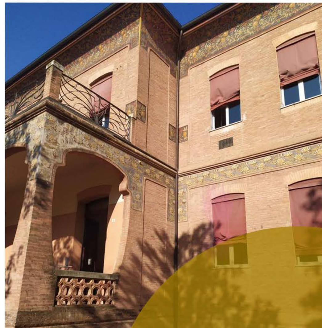
dove siamo ??

Alfredo raffigurò sulla vostra scuola un laghetto con tante ninfee. Perché? Perché scelse proprio questo bel fiore?