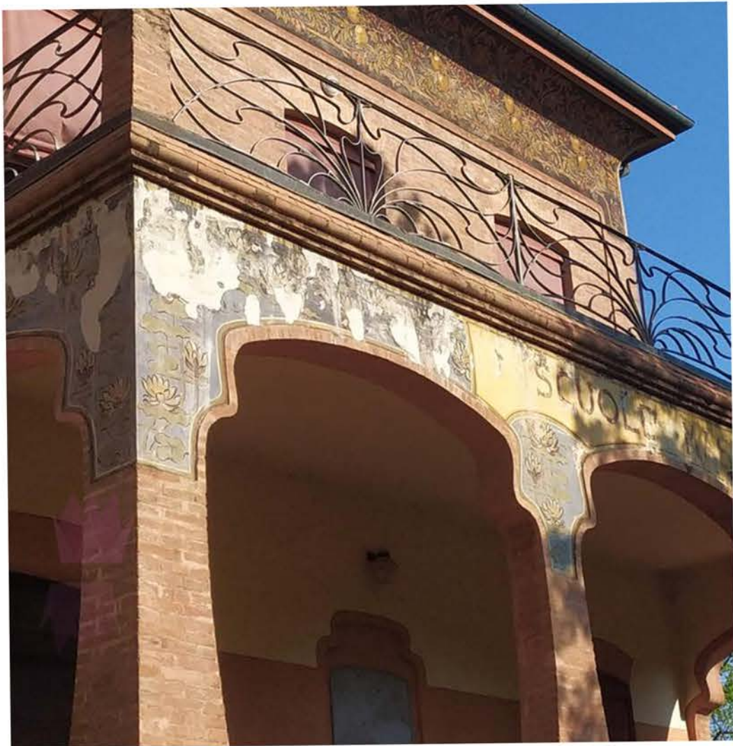
scuola elementare di budrio.